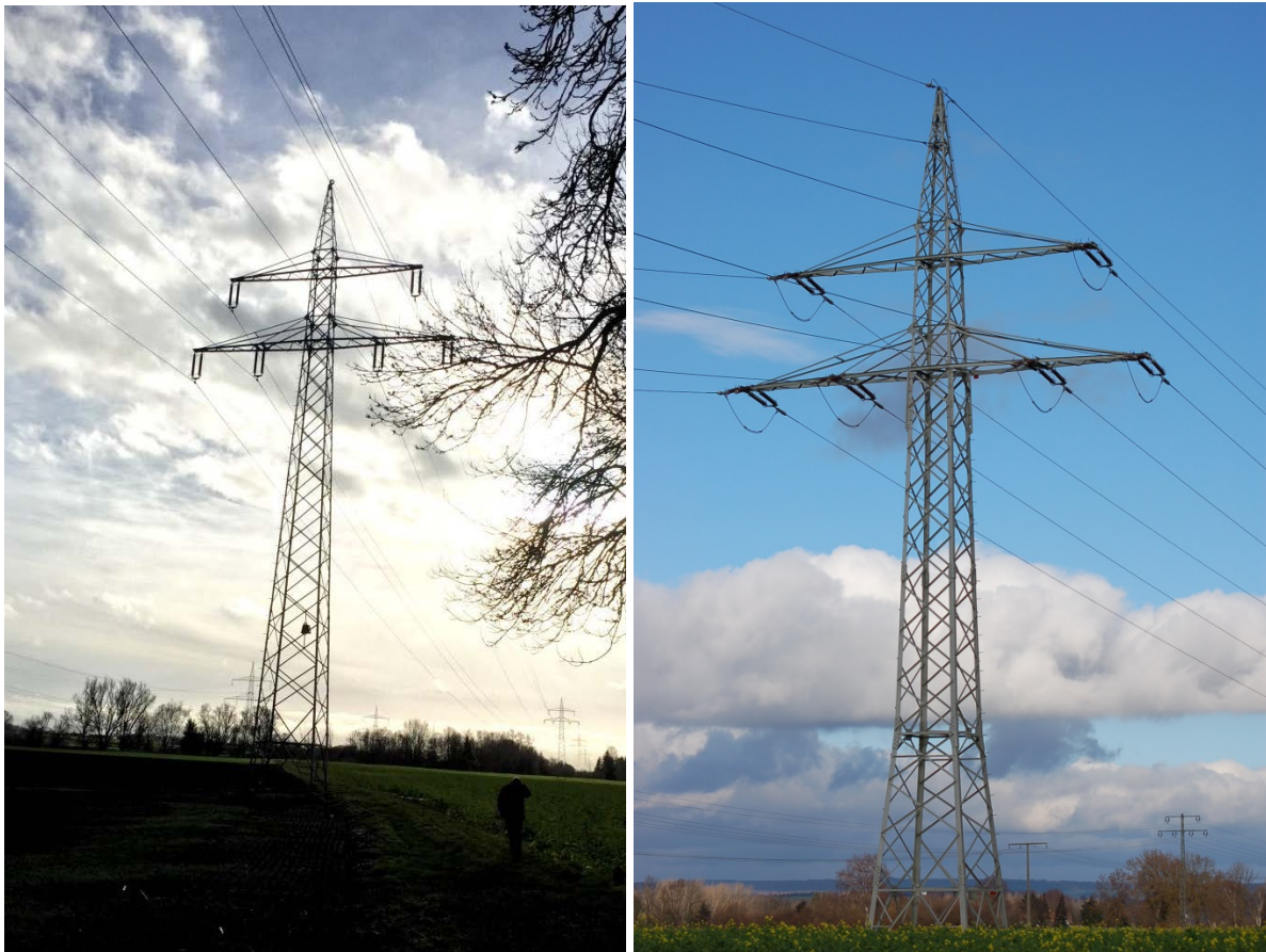
Abbildung 3: Bestehende Masten 03 (T) und 11 (WA) der 110-kV-Leitung mit Einfachseil

Die bestehende 110-kV-Freileitungsanlage Dellmensingen – Achstetten, LA 0007 besteht aus insgesamt 11 Masten, auf welchen sich zwei Stromkreise befinden. Die Leitungsanlage hat eine Länge von ca. 4,2 km. Alle Masten wurden im Jahr 1964 erbaut.