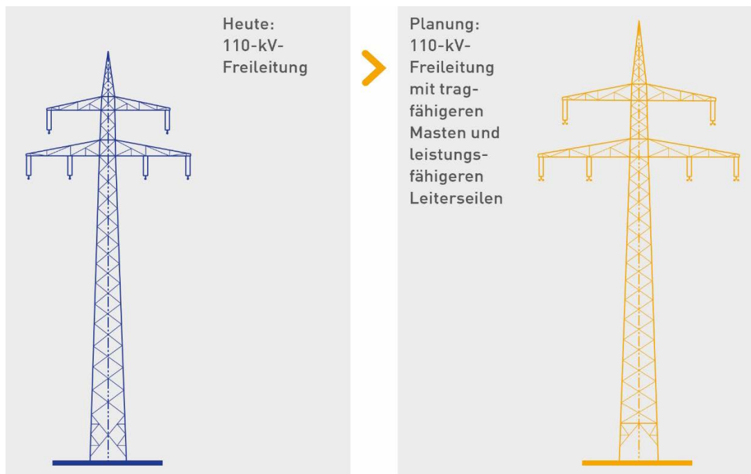
Abbildung 4: Tragmast Bestand (schwarz) und nach Neubau (rot)

Im Zuge des Vorhabens ist geplant, beide bestehenden Stromkreise mit Einfachseil durch ein Zweierbündel zu ersetzen. Die Masten sind aus maststatistischen Gründen nicht für die geplante Beseilung ausgelegt, müssen vollständig abgebaut und durch neue Masten standortgleich ersetzt werden. Das bestehende Mastbild „Donau“ bleibt gleich (s. Mastbildvergleich).