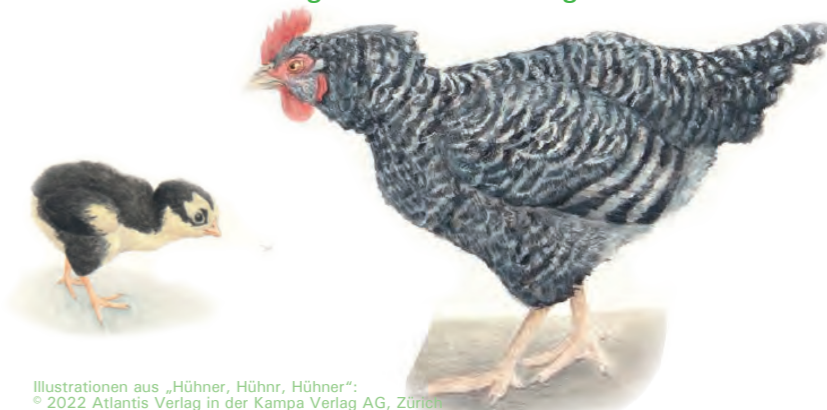
Illustrationen aus „Hühner, Hühner, Hühner“: © 2022 Atlantis Verlag in der Kampa Verlag AG, Zürich

Informationen zum Honorar: Fachstelle Freiburg