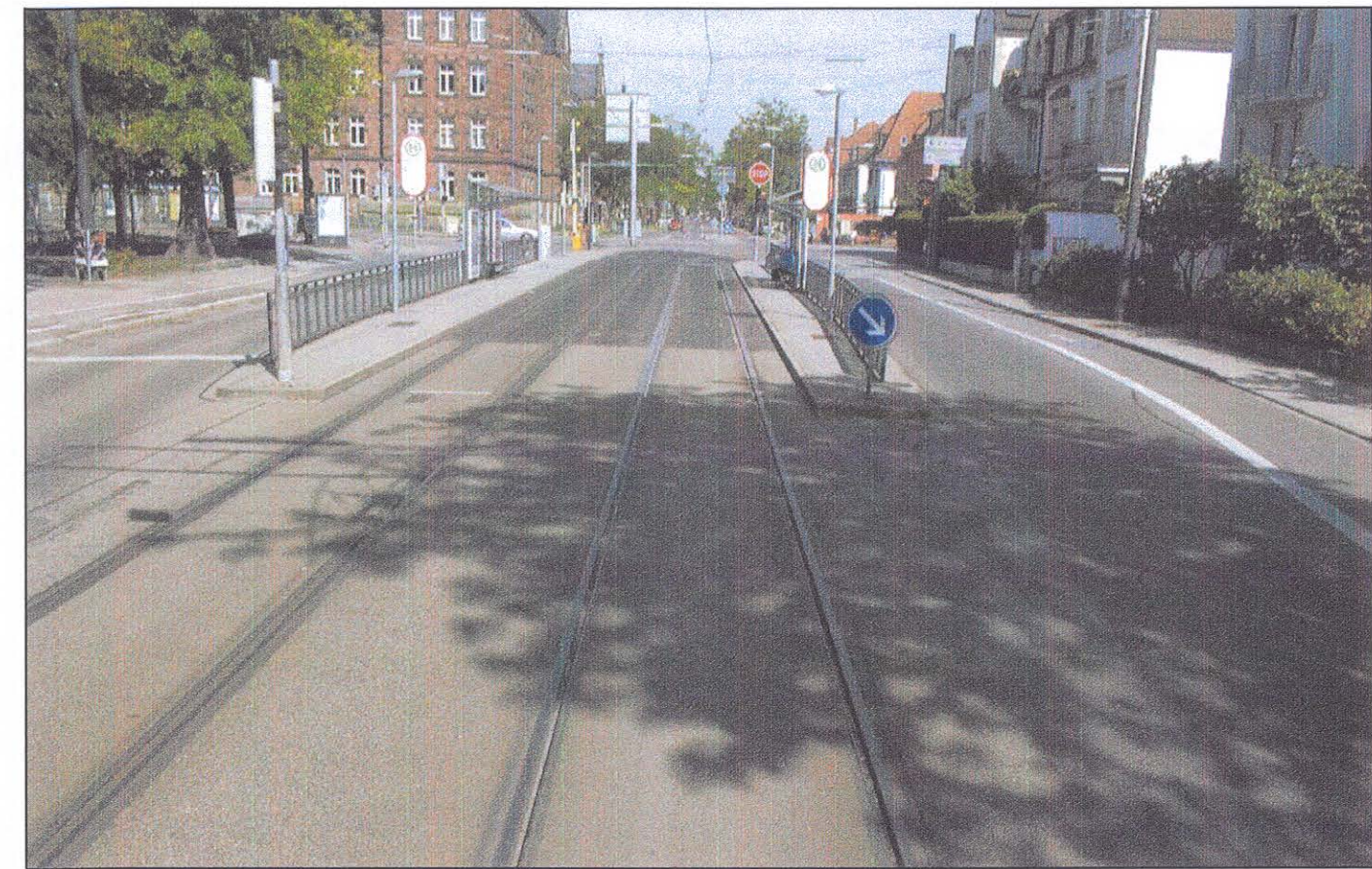
Fotostandort: Fahrtrichtung Yorckstraße