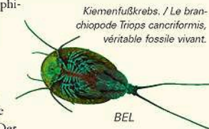
Kiemenfußkrebs. / Le branchiopode Triops cancriformis, véritable fossile vivant.

Die Druckwassertümpel dagegen bieten nur wenigen Arten eine Heimat. Und das auch nur vorübergehend. Genau genommen sind es auch gar keine Tümpel, sondern eher riesige, flache Wasserlachen, die sich vor allem im Frühjahr bei Rheinhochwasser auf Feldern und Stromtalwiesen bilden. Der hohe Grundwasserstand speist diese Lebensräume auf Zeit. Genau das also, was viele Amphibien als Kinderstube für ihren Nachwuchs brauchen. Wechsel-, Kreuz- und Knoblauchkröten legen ihren Laich nur in solche temporäre Gewässer. Der Grund: Sie müssen die Kinderstube nicht mit Fraßfeinden wie räuberisch lebenden Wasserwanzen, Käfern und Fischen teilen. Zu fressen gibt es dennoch genug, schließlich nutzen auch viele Stechmückenarten solche Gewässer als Kinderstube. Ganz selten kann man hier auch die Kiemenfußkrebse im Wasser beobachten, Relikte aus der Urzeit. Dieser rund 10 cm lange Krebs ist die älteste lebende Tierart der Welt, die der Wissenschaft bekannt ist.