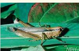
In ganz Deutschland selten: die Lauschschrecke. / Une rareté dans toute l'Allemagne, le Criquet des roseaux (Parapleurus alliaeus).