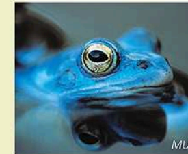
Der Frosch, der gelegentlich blau wird: der vom Aussterben bedrohte Moorfrosch. Une grenouille qui peut vivre au bleu: la Grenouille des champs menacée de disparition.

Wer alles so offen zeigt, der muss doch etwas zu verbergen haben. Elfen vielleicht? Geister oder gar Hexen? Viel besser: Moorfrösche. Die während der Paarungszeit im Frühjahr blau gefärbten Moorfroschmännchen sind nämlich mehr als nur einen kurzen Blick wert. Sie sind die Farbtupfer in der europäischen Froschwelt. Sie legen ihre Laichballen häufig im Wasser der Erlen-Bruchwälder ab. Auch die sehr selten gewordenen Mückenfledermäuse und verschiedene Schnepfenarten sind in Bruchwäldern zu Hause.