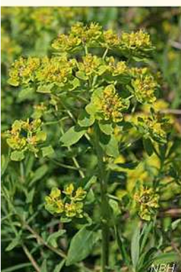
Die Sumpfwolfsmilch wächst auf nassen, kalkhaltigen Böden. L'Euphorbia des marais (Euphorbia palustris) recherche des sols calcaires humides.