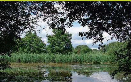
Biotope aus zweiter Hand: die Lettenlöcher. / Biotope secondaire, des trous de glaise.

Die dritten wichtigen Gewässer in der Rheinniederung bei Dettenheim verdanken ihre Existenz dem Menschen. Lettenlöcher ④, wie die vielen Tümpel rings um Alt-Dettenheim genannt werden, sind nämlich durch den Abbau von Ton entstanden. Heute sind es vor Leben strotzende Kleinode. Viele Wasserpflanzen, wie die Seerose oder der insektenfressende Wasserschlauch, gedeihen hier und mit der Zierlichen Moosjungfer auch eine Libellenart, die man in ganz Baden-Württemberg fast nur noch in Dettenheim beziehungsweise in der Rheinniederung bei Karlsruhe findet.