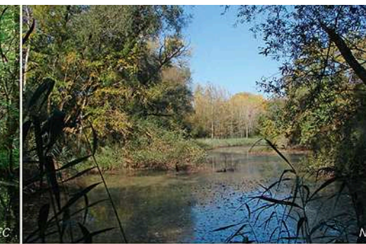
Ein verwunschener Märchensee, der in Wirklichkeit ein Altrheinarm ist: der Königsee. / Un lac enchanteur comme dans un conte: le Königsee qui en réalité est un ancien bras mort du Rhin.

Selten sind beide Waldarten geworden, die schon seit Urzeiten die Flusstäler prägten. Daher erzählen die letzten Reste dieser einst weit verbreiteten Waldformen auch ein wenig von alten Zeiten, von Zeiten in denen die Natur in der Rheinniederung noch wild und ungezügelt war, von Zeiten in denen die Flüsse und nicht der Mensch die Flussniederungen formten.