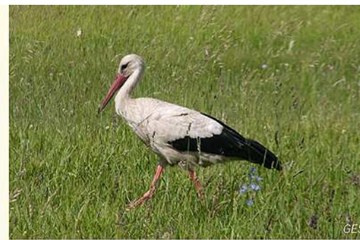
Dank der Arbeit vieler Naturschützer ist Adebar heute wieder ein fast alltäglicher Anblick in den Rheinauen. / Profitant des interventions des protecteurs de la nature, la Cigogne blanche vient à nouveau fréquenter les zones alluviales rhénanes.

Stromtalwiesen findet Adebar nämlich genug Futter für seinen Nachwuchs. Geprägt werden die Wiesen, wie die meisten natürlichen Lebensräume in den Rheinauen, vom Wasser. Wechselfeucht heißt der Zustand, der den Charakter einer Stromtalwiese prägt. Und das bedeutet, die Wiesen sind mal trocken mal feucht, je nachdem wie viel Wasser der Rhein führt, je nachdem wie hoch der Grundwasserstand ist. Stromtalwiesen vereinen also ein wenig den Charakter von Trocken- und Feuchtwiese in sich, und das macht sie so artenreich. Sowohl in Deutschland als auch in ganz Europa zählen die Stromtalwiesen zu den gefährdeten Lebensräumen. Grünlandumbau, Intensivnutzung sowie Deichbau- und Entwässerungsmaßnahmen sind die Hauptsachen für ihren Rückgang.