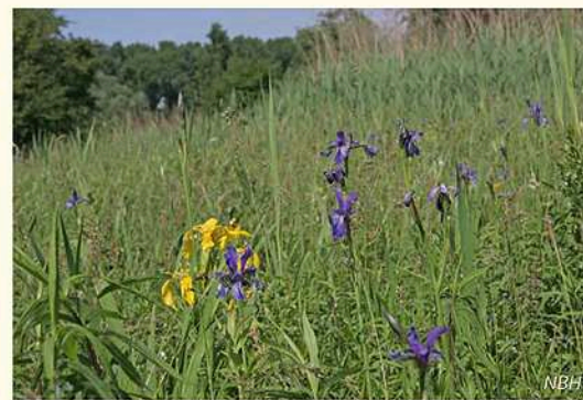
Stromtalwiesen wie sie sein sollten: bunt und voller Leben. / Prairies alluviales telles qu'on les apprécie: diversifiées et pleines de vie.