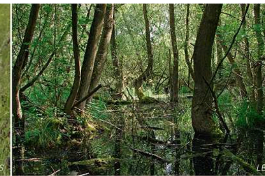
Vor allem Erlen und Eschen vertragen den hohen Grundwasserstand im Bruchwald. / Ce sont avant tout les aulnes et les frênes qui s'accoutument bien de l'engorgement des forêts marécageuses.