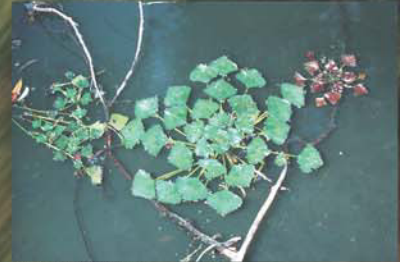
Wassernuss ( Trapa natans )