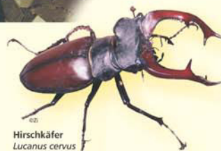
Hirschkäfer Lucanus cervus