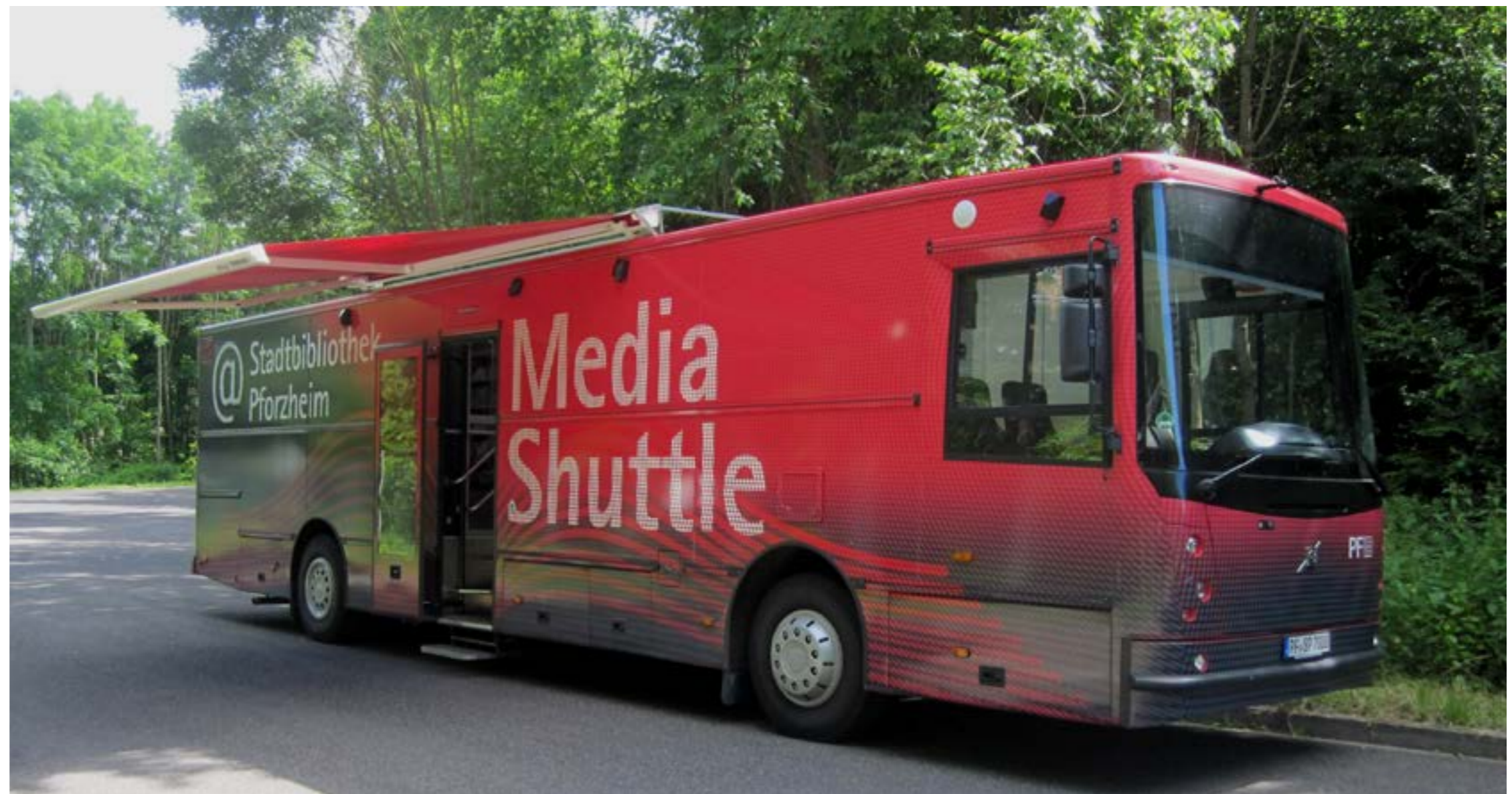
↳ Mediashuttle Pforzheim

Bibliotheken sind erste Ansprechpartner für Lese-, Informations- und Medienkompetenz für Kinder, Eltern, Lehrende und Erziehende, Vereine und andere Multiplikatoren der Bildungsarbeit. Deshalb kooperieren sie kontinuierlich mit Kindertagesstätten, Schulen, Trägern der Erwachsenenbildung sowie freien Initiativen und machen ihre Angebote aktiv bekannt. Jedes Kind hat die Gelegenheit, während der Grundschulzeit an mindestens einem bibliotheksdidaktischen Programm teilzunehmen. Im Zuge des flächendeckenden Ausbaus der Ganztageschulen in Baden-Württemberg werden sich Bibliotheken künftig als Bildungspartner mit eigenen verbindlichen Angeboten in den Schulalltag einbringen. Kinderbibliotheken sind zentrale Bausteine der Bibliotheksarbeit und leisten mit kreativen Angeboten einen wichtigen Beitrag zur kulturellen Bildung.