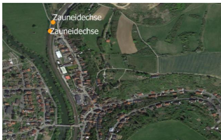
Abbildung 2: Fundpunkte Zauneidechsen BÜ Hofwiesenstraße

Für Reptilien besteht daher eine Betroffenheit für Zauneidechsen.