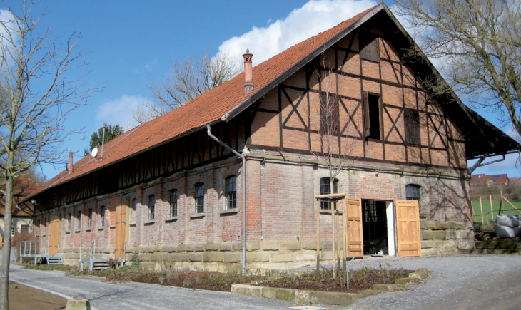
Die Stallscheuer im Hofgut Cappel