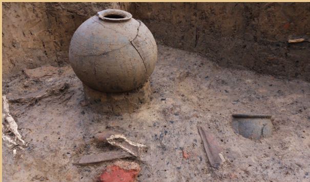
Ausgrabung an der Schmalen Straße im Jahr 2013. Römische Funde auf dem Boden einer Abfallgrube