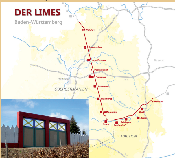
Rekonstruiertes Limestor Öhringen und Übersichtskarte mit dem Verlauf des Limes in Baden-Württemberg

Der Titel Garten Träume GRENZ RÄUME für die Ausstellung des Landesamts für Denkmalpflege auf der Landesgartenschau in Öhringen verrät bereits die beiden Schwerpunkte der Schau: