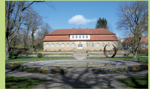
Hofgut Cappel, Orangerie

Der Ausstellungsort ist übrigens selbst ein Kulturdenkmal. Die ehemalige Stallscheune des Hofguts Cappel stammt aus dem 19. Jahrhundert. Mit seinem rustikalen Charme und seinem authentischen Ambiente passt der alte Viehstall bestens zur Denkmalpflege-Ausstellung in der Landesgartenschau Öhringen.