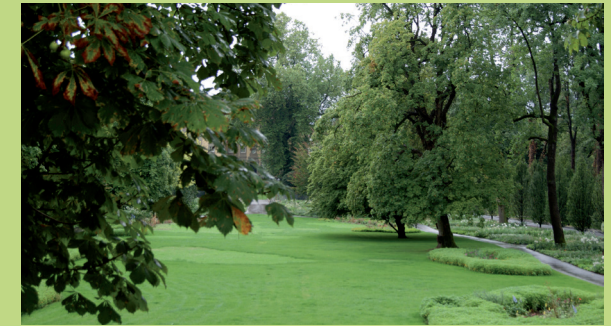
Öhringen, Hofgarten (oben) und Orangerie (unten)