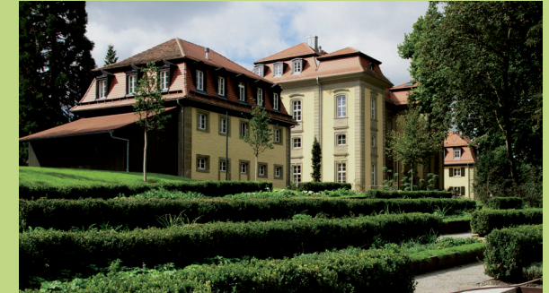
Hofgarten Öhringen, Hoftheater