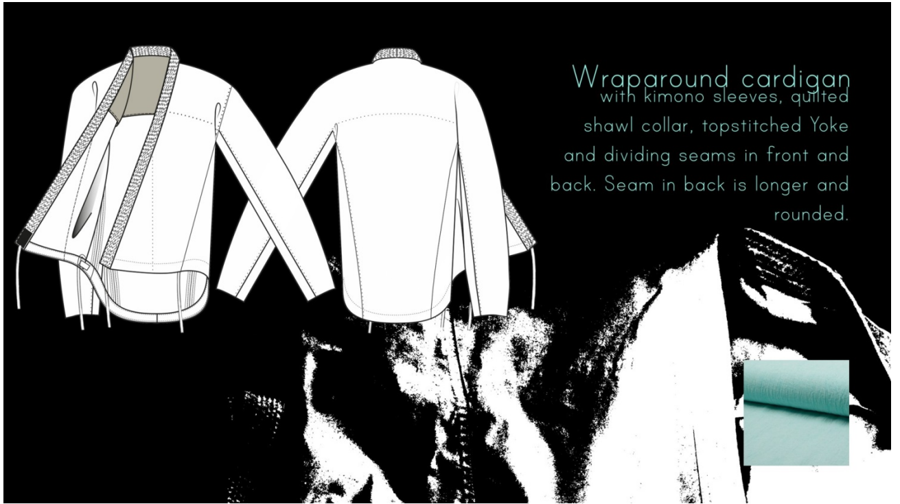
Wraparound cardigan with kimono sleeves, quilted shawl collar, topstitched Yoke and dividing seams in front and back. Seam in back is longer and rounded.