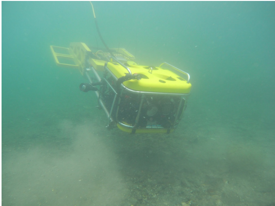
Remotely operated vehicle