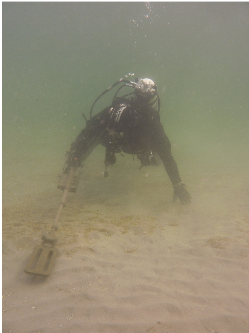
Taucher mit Sidescan-Sonar