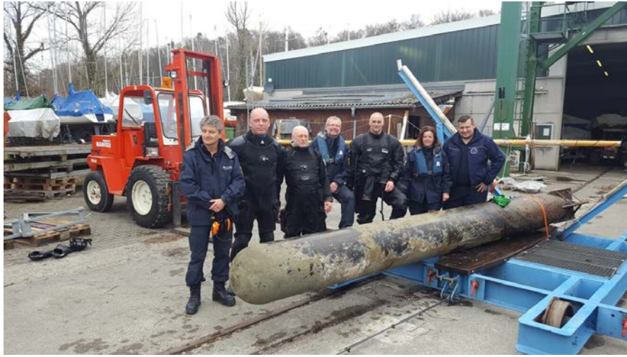
Bergungsteam KMBD und WSP