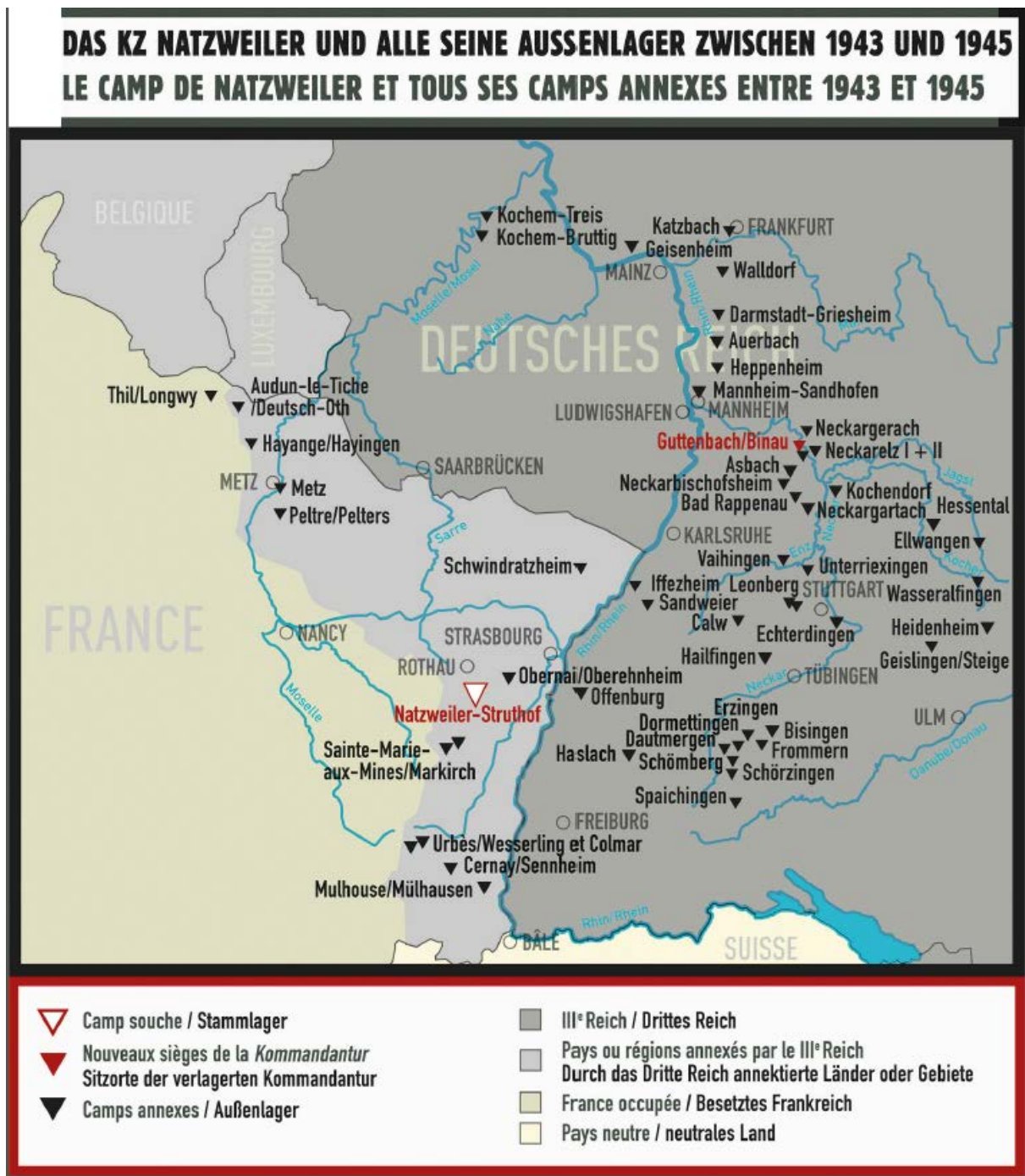
Abb 1: Karte des KZ Natzweiler-Struthof und seiner Außenlager (© Landeszentrale für politische Bildung Baden-Württemberg)