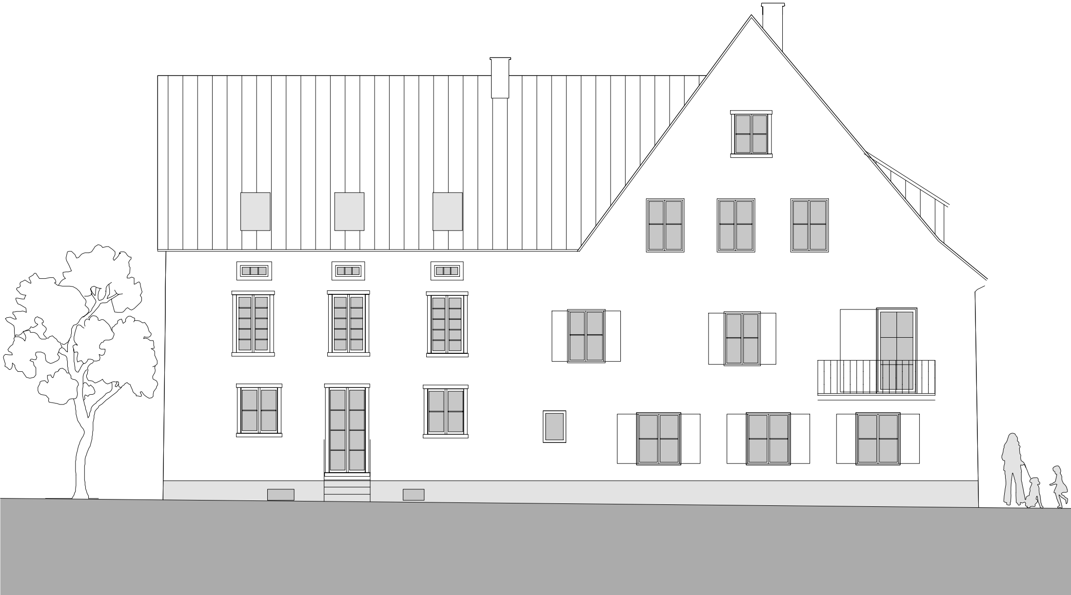
Ansicht Fluss Seite