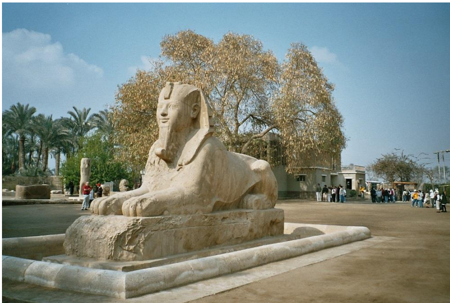
e) Sphinxstatue in Assuan (Ägypten)