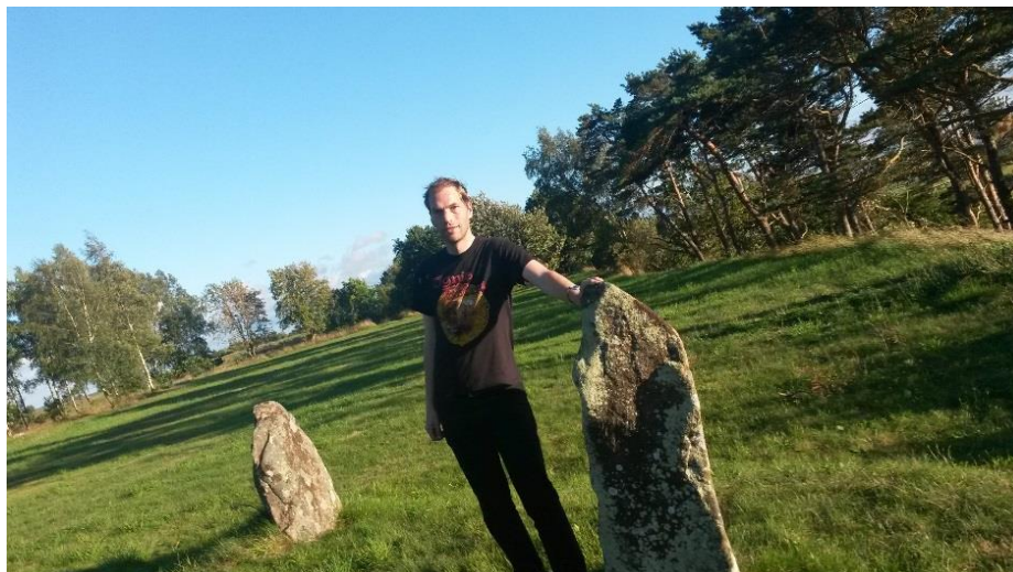
b) bekannte Runensteine in Småland (Südschweden) Person unbekannt