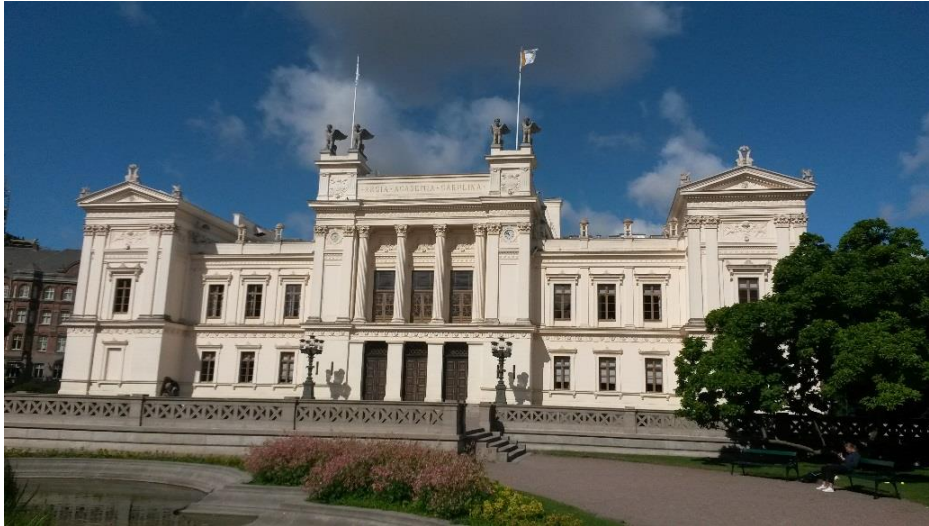
d) Hauptgebäude der Universität Lund, aufgenommen vom Universitäts- gelände aus