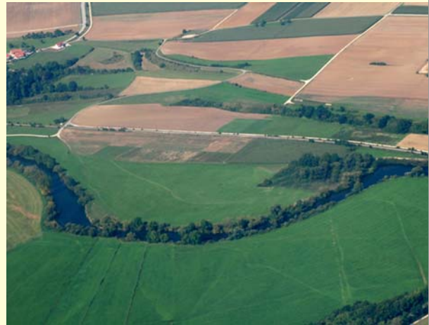
Zustand vor der Renaturierung