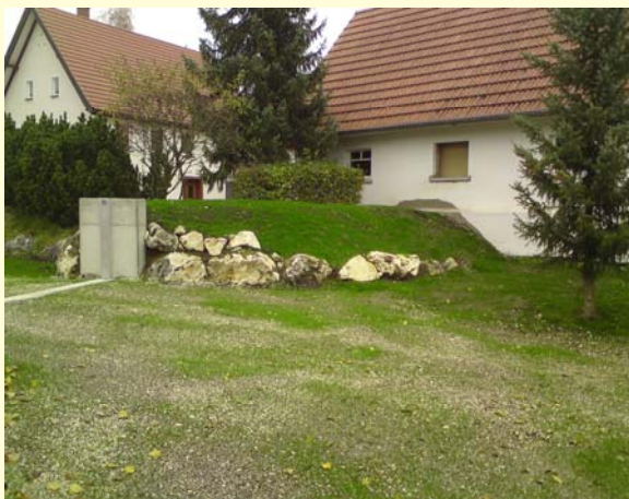
Deich mit Öffnung Dammbalkenverschluss

Zum Schutz des Stadtteils Ehingen wurden neben neuen, kurzen Deichabschnitten auch Mobile Dammbalkenverschlüsse und Hochwasserschutzmauern erstellt, sowie Gebäudezugänge höher gelegt und angeströmte Gebäudeflächen mit einem Sperrputz versehen.