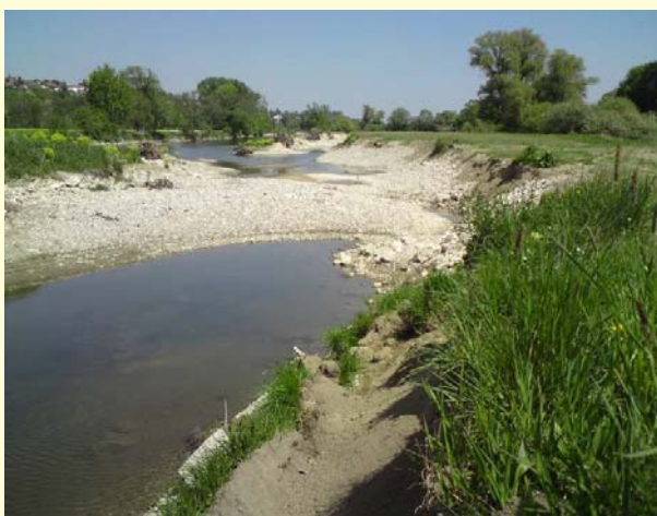
Uferaufweitung (Bauabschnitt 1)

BT 3: Zwischen km 2611,400 – 2610,850 wird ein bestehender Altarm an die Donau angeschlossen.