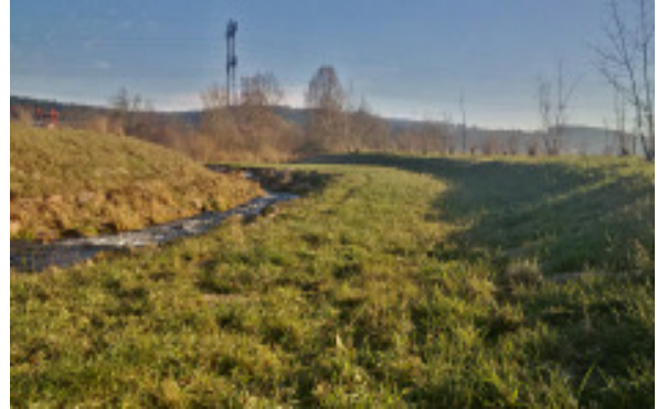
Bild Zustand nach Umsetzung