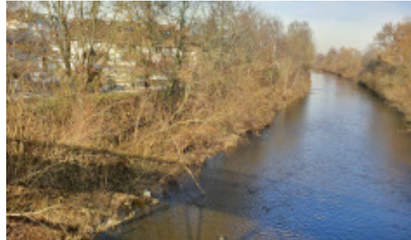
Zustand vor der Sanierung