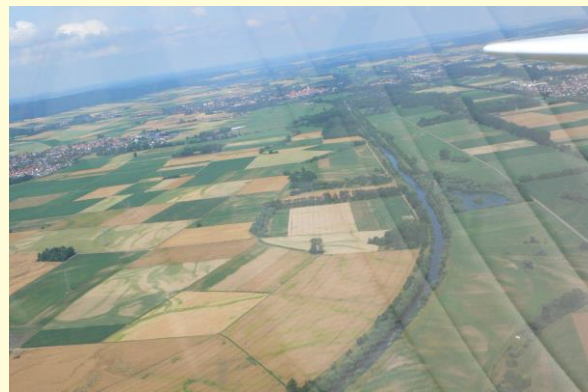
Blick auf die „Rennstrecke“, rechtsufrig der sanierungsbedürftige Damm