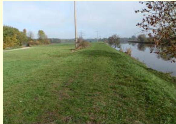
Zustand vor Umbau

Ökologische Aufwertung durch Aufweitung Schaffung von naturnahen Uferstrukturen Zulassung einer gewissen Eigendynamik Anschluss eines Altarmes