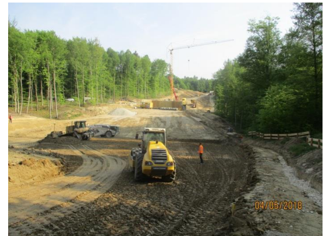
Bodenverbesserung auf der Strecke