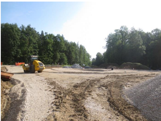
Herstellen der Frostschutzschicht für den Kreisverkehrsplatz Nord