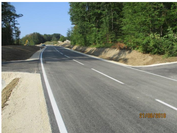
Neuer Fahrbelag der B 313 zwischen Grafenberg und Tischardt