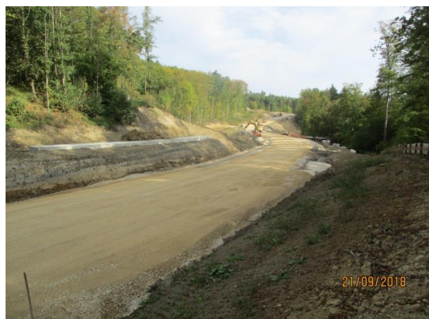
Aufbringen der Frostschutzsicht auf der Strecke