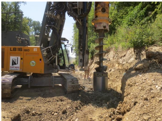
Herstellen der Bohrpfähle für die Bohrpfahlwand 2