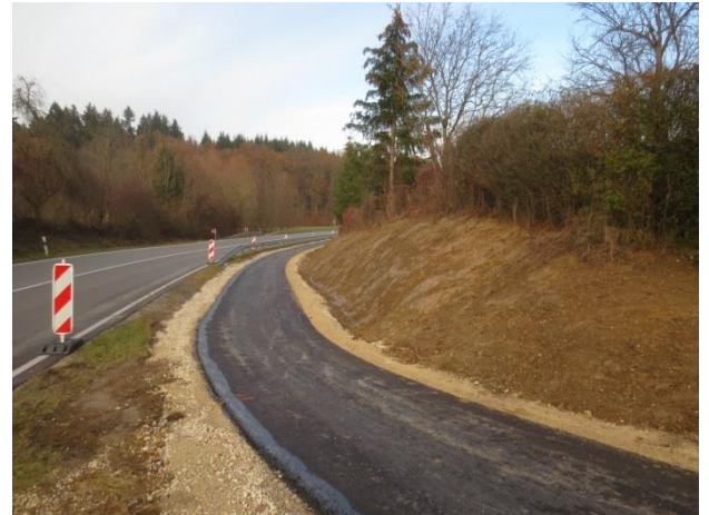
Radweg zwischen Metzingen - Neugreuth und Grafenberg mit Blickrichtung nach Grafenberg