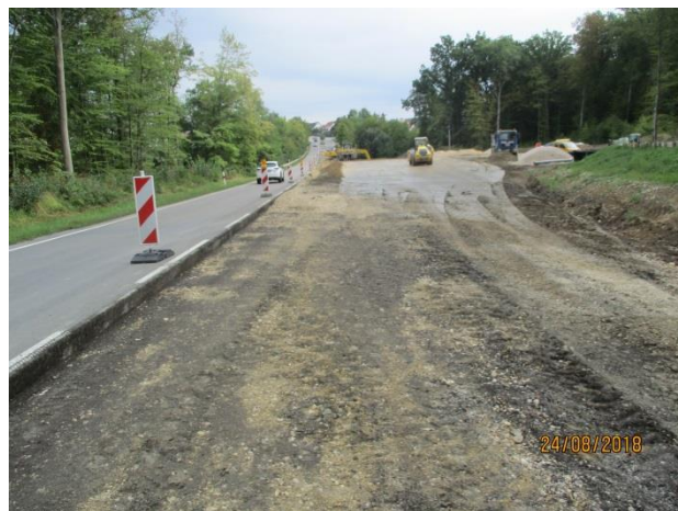
Asphaltfräsarbeiten am Kreisverkehrsplatz Süd