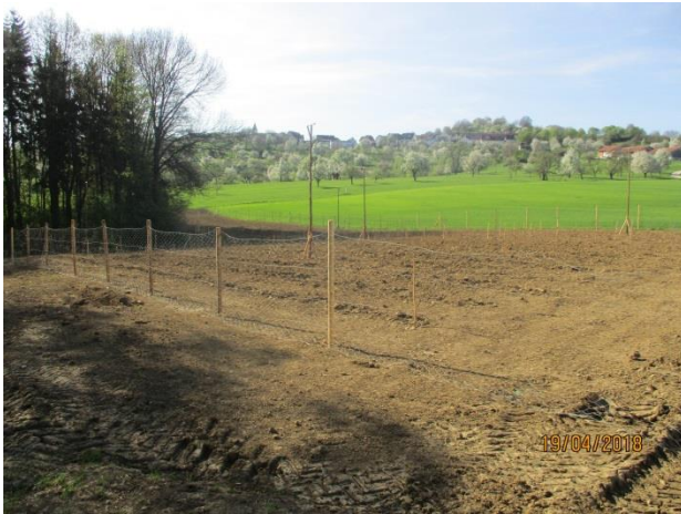
Aufforstungsmaßnahme am Pfarrwald