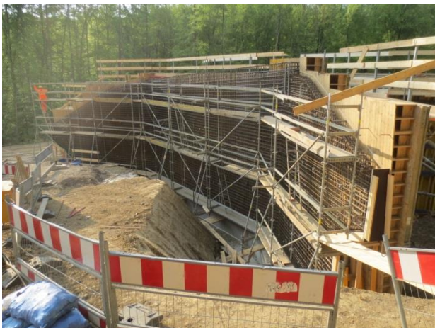
Bewehrungsarbeiten am Flügel des Unterführung Fuß- und Wirtschaftsweg auf der Seite Nürtingen