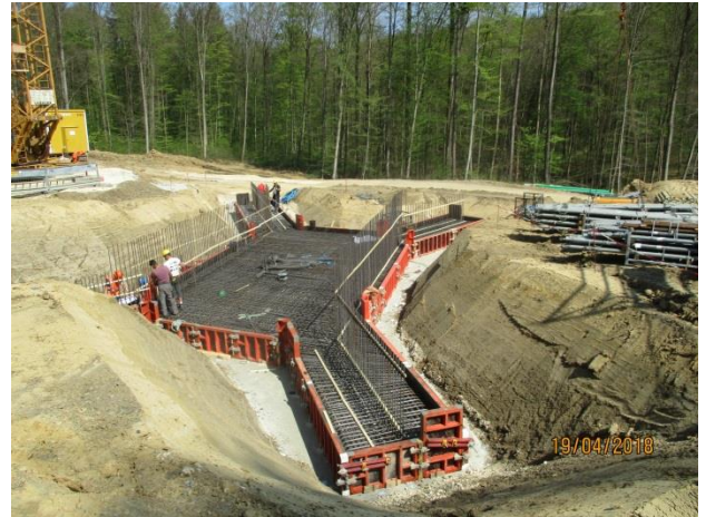
Gründung Bauwerk 5 Unterführung Fuß- und Wirtschaftsweg