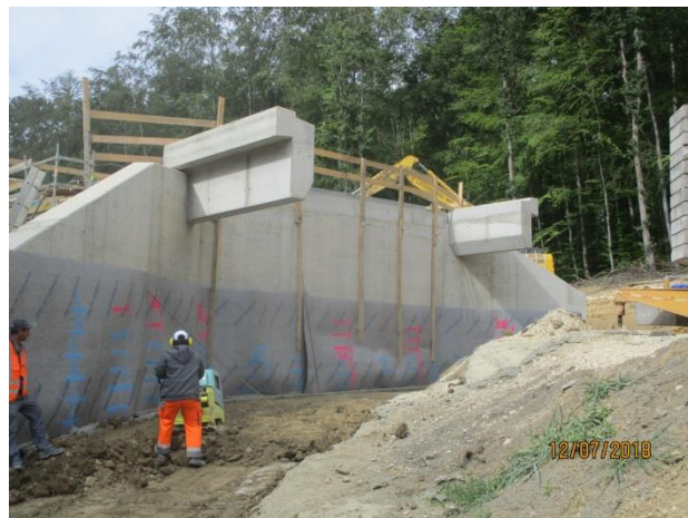
Bauwerkshinterfüllung Bauwerk 5 Unterführung Fuß- und Wirtschaftsweg