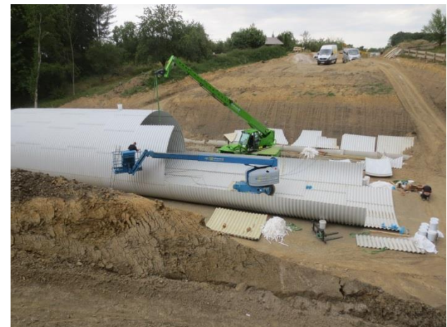
Montage des Wellstahldurchlasses Bauwerk 2b