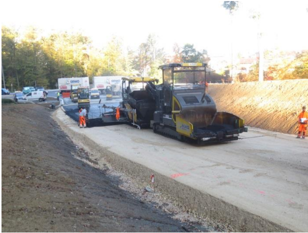
Einbau der Asphalttragschicht auf der Strecke mit Blickrichtung zum Kreisverkehrsplatz Süd