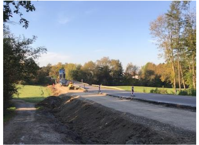
Herstellen der Schottertragschicht für den neuen Radweg zwischen Metzingen und Grafenberg