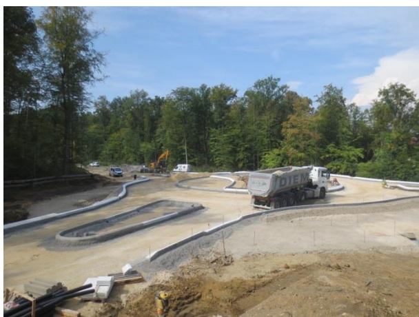
Kreisverkehrsplatz Süd mit Blickrichtung nach Metzingen