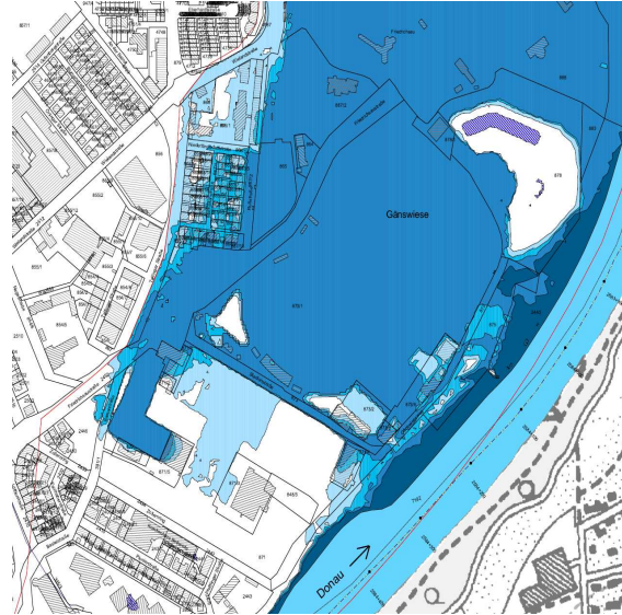
Zustand heute (überschwemmte Flächen bei HQ100)

(unter Berücksichtigung des Klimafaktors)