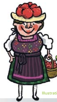
Illustrationen: ©Steph Burlefinger