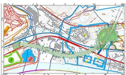
Autobahn GmbH des Bundes