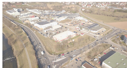
Ingenieurbüro RAPP RegioPlan