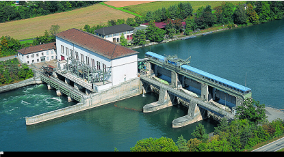
Kraftwerk Reckingen AG