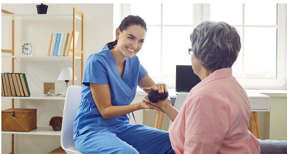
Studio_Romantic - stock.adobe.com