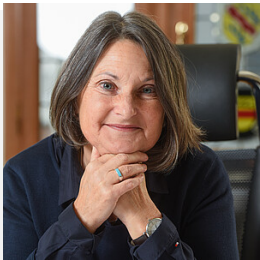
Regierungspräsidentin Bärbel Schäfer