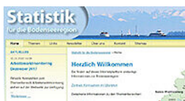
Plate-forme statistiques du lac de Constance

L'IBH, la Conférence internationale du lac de Constance (IBK) et INTERREG-V-Alpenrhein-Bodensee-Hochrhein encouragent les réseaux de recherche et d'innovation des universités et des partenaires de l'industrie et de la société à travers les laboratoires thématiques de l'IBH. Ils contribuent ainsi de manière durable à la promotion de la connaissance, de l'innovation et du transfert de technologie et donc à l'attractivité de la région du lac de Constance en tant que site.