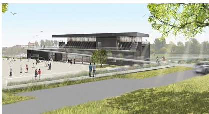
Hugues Architects Mulhouse

ArtRhena: Grenzüberschreitendes Kulturzentrum auf der Rheininsel zwischen Breisach und Neuf-Brisach