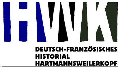
Deutsch-Französisches Historial Hartmannswillerkopf

PK309: Fußgänger- und Radwegeverbindung über den Rhein zwischen der Gemeinde Gamsheim und der Stadt Rheinau Mehr Informationen