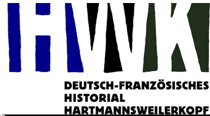
Deutsch-Französisches Historial Hartmannswillerkopf

Historial auf dem Hartmannswillerkopf: Deutsch-französisches Historial zum Ersten Weltkrieg