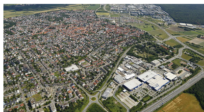
H&B Pressebild Pfeifer