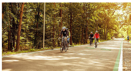
Ministerium für Verkehr Baden-Württemberg/Valentin Marquardt