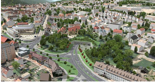
Ostportal 3D neu