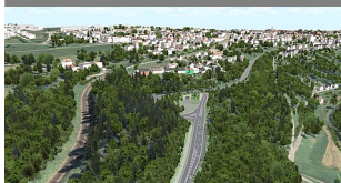
Westportal 3 D neu