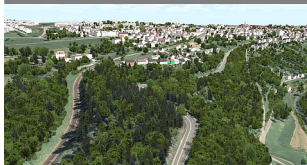
Westportal 3 D Bestand