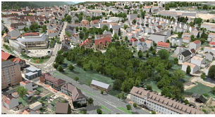
Ostportal 3 D Bestand