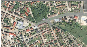
Ostportal 2 D Bestand