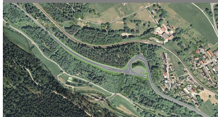
Westportal 2D neu