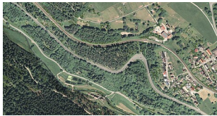
Westportal 2 D Bestand