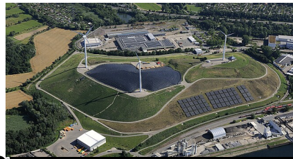
Stadt Karlsruhe - Amt für Abfallwirtschaft

Referat 54.1 - Industrie, Schwerpunkt Luftreinhaltung