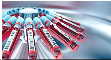
Connect world - stock.adobe.com