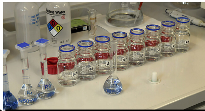
Landesanstalt für Umwelt B.-W.