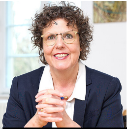
Regierungspräsidium Karlsruhe | Stollberg

Jedes Regierungs-Präsidium hat eine Chefin oder einen Chef.