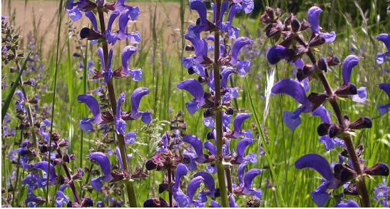
Wiesen-Salbei - Salvia pratensis