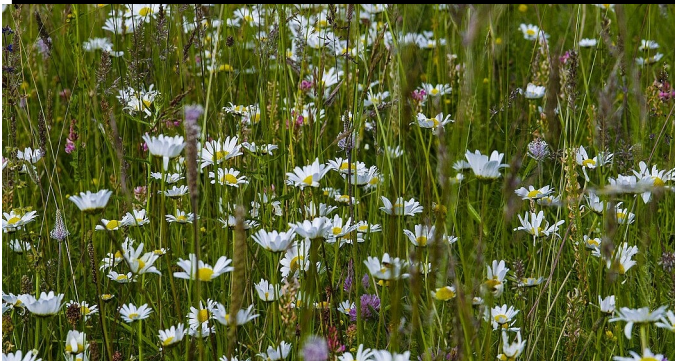
Europäisch geschützte Mähwiese Margerite