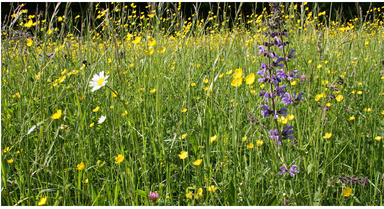
Europäisch geschützte Mähwiese (Salbei, Hahnenfuß und Margerite)