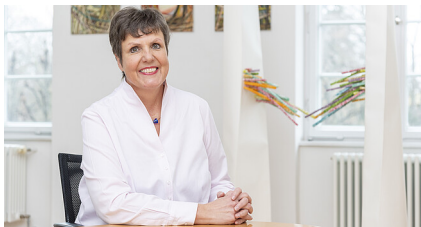
Regierungspräsidium Karlsruhe - Stollberg

Die Struktur des Regierungspräsidiums befindet sich in stetigem Wandel. Aufgabenzuwachs, neue Schwerpunkte der Gesetzgebung und Politik und immer geringere Spielräume in den öffentlichen Haushalten haben einen permanenten Prozess der Erneuerung und des Umdenkens vorangetrieben. Bei der letzten großen Verwaltungsreform wurden viele ehemals selbständige Fachbehörden unter dem gemeinsamen Dach "Regierungspräsidium" zusammengefasst zu einer schlanken und universell zuständigen Allround-Behörde.