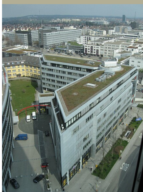
Markus Böhm für RPS