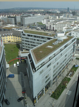
Markus Böhm für RPS