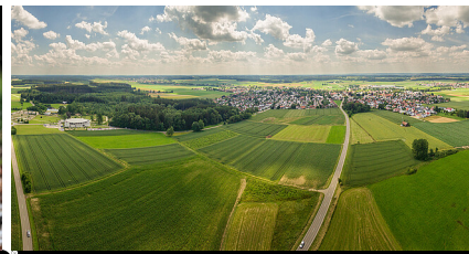
reichdernatur - stock.adobe.com