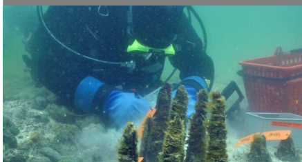
Arbeiten unter Wasser