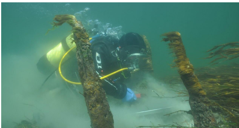
Arbeiten unter Wasser

Neue Publikation: Der Orkopf - Eine Fundstelle auf der Landesgrenze