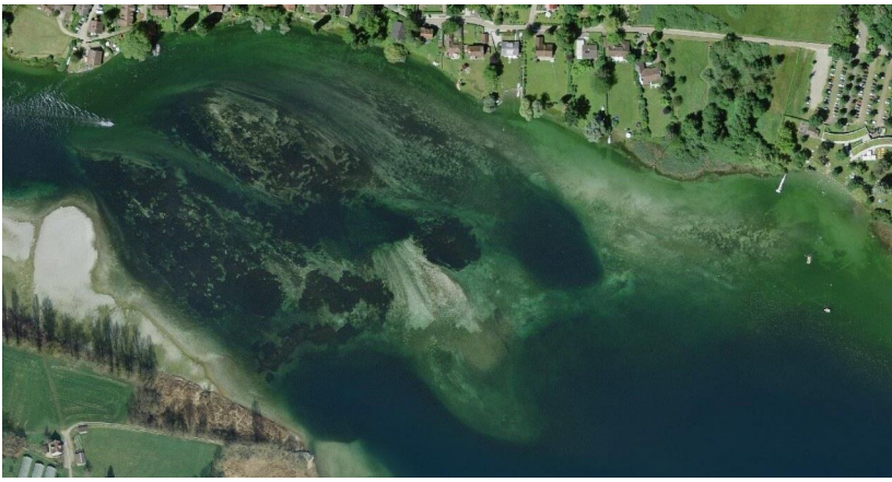
Orkopf aus der Luft