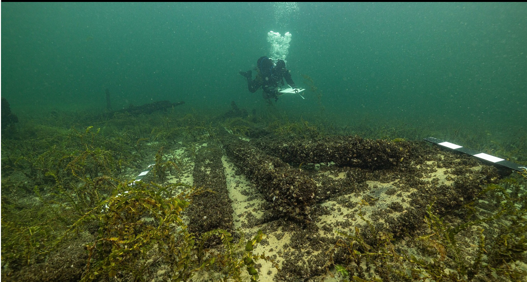
Landesamt für Denkmalpflege im Regierungspräsidium Stuttgart / Submaris