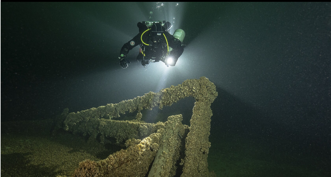
Landesamt für Denkmalpflege im Regierungspräsidium Stuttgart / Submaris

Der Bodensee ist bekannt für die Pfahlbausiedlungen, die im Flachwasser und unter dem heutigen Ufer Jahrtausende überdauert haben. Doch an seinem Grund befinden sich auch unzählige Wracks von Schiffen und Flugzeugen, die zu unterschiedlichen Zeiten in den Fluten untergingen – Denkmale, die auch als solche geschützt werden müssen. Das Landesamt für Denkmalpflege im Regierungspräsidium Stuttgart (LAD) startet daher nun das vierjährige Projekt „Wracks und Tiefsee“, um bisher unentdeckte Wracks zu orten und zu dokumentieren.