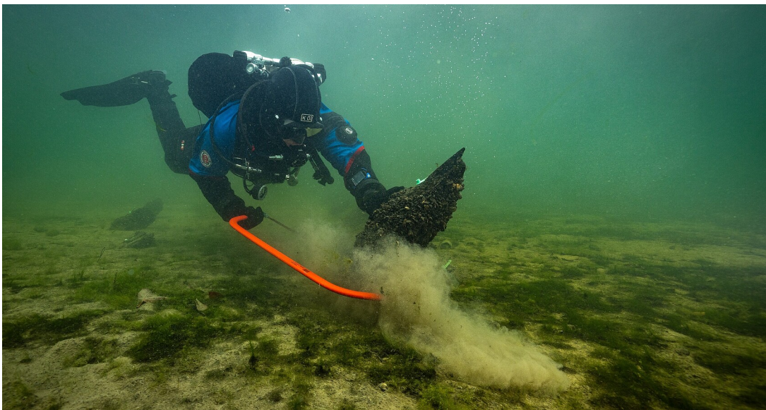
Landesamt für Denkmalpflege im Regierungspräsidium Stuttgart / Submaris

Neues Projekt des Landesamts für Denkmalpflege erforscht Wracks im Bodensee