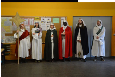
Sternsinger der Kirchengemeinde Sankt Vitus, Quelle: RPS