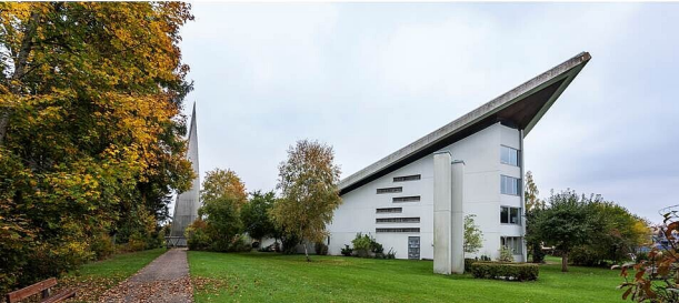
Landesamt für Denkmalpflege im Regierungspräsidium Stuttgart / Felix Pilz

Die Wanderschau „ZWÖLF – Kirchenbauten der Nachkriegsmoderne in Baden-Württemberg“, die zwölf virtuose Raumschöpfungen der 1960er und 70er Jahre aus raffinierten Formen und geschickt eingesetzten Materialien zeigt, musste pandemiebedingt pausieren. Jetzt geht sie mit Station Nummer 12 in Villingen ins große Finale. In der katholischen Kirche St. Konrad, erbaut 1964 bis 1967 nach Plänen des Architekten Emil Obergfell, zeigt die Schau beispielhafte Vertreter für diese theologische wie architekturgeschichtliche Umbruchzeit im Kirchenbau nach 1945. Sie ist dort von Sonntag, 29. Mai 2022, bis Mittwoch, 29. Juni 2022, zu besichtigen. Die Kirche und die Ausstellung sind täglich von 9:00 bis 19:00 Uhr geöffnet. Es gelten die aktuellen Corona-Bestimmungen. Der Eintritt ist frei.