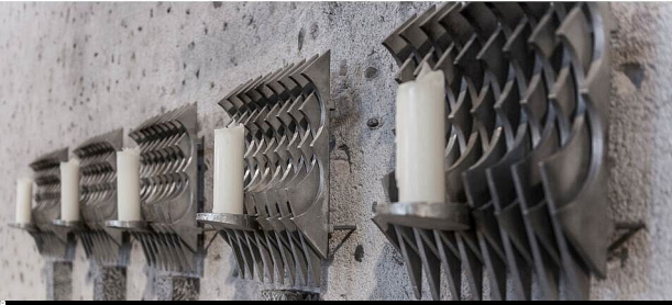
Landesamt für Denkmalpflege im Regierungspräsidium Stuttgart / Felix Pilz