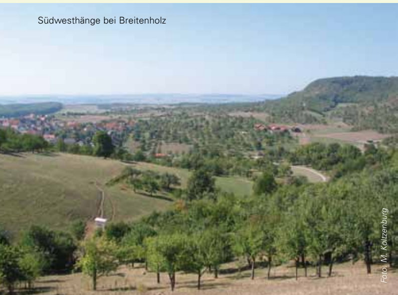
Südwesthänge bei Breitenholz

Doch die reich gegliederte Kulturlandschaft der Schönbuch-Hänge ist im Wandel begriffen. Die Erzeugung von Streuobst und blütenreichem Mähgut ist in Zeiten intensiver Landwirtschaft nicht mehr auskömmlich. Ohne eine regelmäßige, kleinbäuerliche Nutzung verbrachen die offenen Wiesenhänge, der landschaftliche Reiz und die Artenvielfalt schwinden.