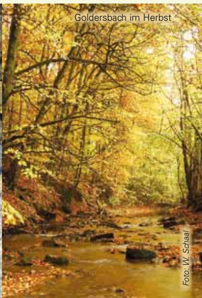
Goldersbach im Herbst