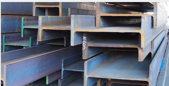
Elke Swain | RPT

2020: Aktuelle Meldung: E-Liquids - was ist drin? Ergebnisse des Kooperationsprojektes mit den Chemischen und Veterinäruntersuchungsämtern (CVUA) in Sigmaringen und Karlsruhe und dem Bundesinstitut für Risikobewertung (BfR) in Berlin