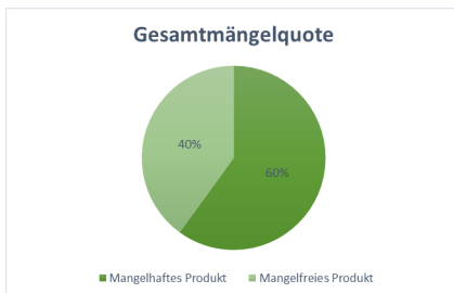
Abbildung 2: Gesamte Mängelquote der 10 geprüften Pelztextilen

Die Gesamtmängelquote ist in Abbildung 1, die Aufschlüsselung der Prüfkriterien und der gefundenen Mängel sind in Abbildung 3 (bei einer Gesamtzahl von 10 Prüflingen) zusammengefasst. Die Einzelergebnisse sind dem Anhang (Tabelle 2) zu entnehmen.