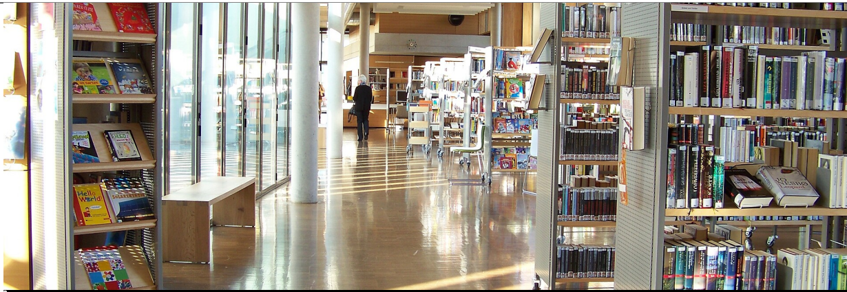
Bibliothek Mediothek Dusslingen