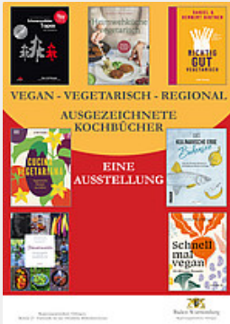
VEGAN - VEGETARISCH - REGIONAL - AUSGEZEICHNETE KOCHBÜCHER - EINE AUSSTELLUNG