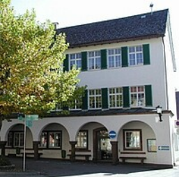
Stadtbücherei Isny im Allgäu

Thekenbereich der Gemeinde- und Schulbücherei Horgenzell im Gebäude der Gemeinschaftsschule