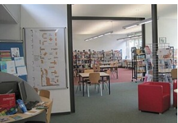
Gemeindebücherei im Bildungszentrum Bodnegg

Gemeindebücherei Grund- und Hauptschule Baidt