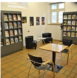
Stadtbücherei Bad Waldsee

Eingangs- und Verbuchungsbereich der Bücherei im Alten Theater Bad Waldsee mit Lesetischen und Ausgang ins Obergeschoss