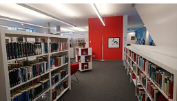
RPT, Ref. 23.5

Loungemöbel in der Kinderbücherei der Stadtbücherei Isny im Allgäu