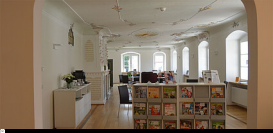
Stadtbücherei Bad Wurzach

Sitzecke in der Mediothek BIB.box - nicht öffentliche Zweigstelle der Stadtbücherei Bad Waldsee im Schulzentrum Döchtbühl