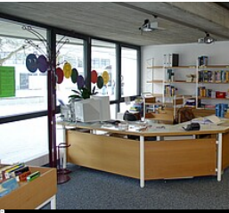
Gemeinde- und Schulbücherei Horgenzell

Thekenbereich der Gemeinde- und Schulbücherei Horgenzell im Gebäude der Gemeinschaftsschule