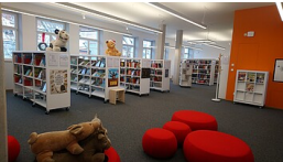
RPT, Ref. 23.5

Kinderbücherei in der Stadtbücherei Isny im Allgäu