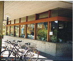
RPT, Ref. 23.5

Ehemaliges Kaminzimmer mit goldverzierten Stuckdecken und 2 roten Ohrensesseln, jetzt Lesecafè in der Stadtbücherei Bad Wurzach im ehemaligen Kloster "Maria Rosengarten"