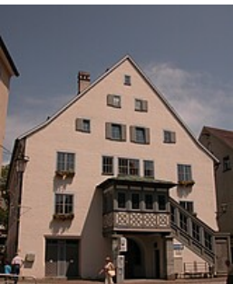
RPT, Ref. 23.5

Romanbereich der Stadtbücherei Isny im Allgäu mit Piktogramm von Otl Aicher als Wegweiser