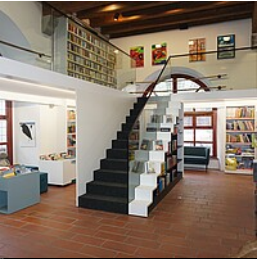
Stadtbücherei Wangen im Allgäu

Blick von der Galerie ins Erdgeschoss mit Verbuchung und Kinderbereich in der Stadtbücherei im Kornhaus Wangen im Allgäu