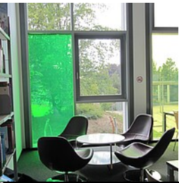
Stadtbücherei Bad Waldsee

Sitzecke in der Mediothek BIB.box - nicht öffentliche Zweigstelle der Stadtbücherei Bad Waldsee im Schulzentrum Döchtbühl