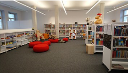
RPT, Ref. 23.5

Stadtbücherei Isny im Allgäu im Hallgebäude