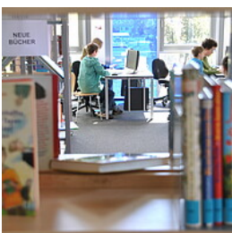
Stadtbücherei Bad Waldsee

Zeitschriftenecke in der Stadtbücherei Bad Waldsee