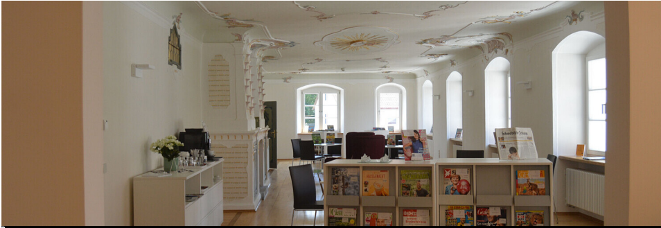
Stadtbücherei Bad Wurzach