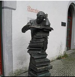
Stadtbücherei im Kornhaus, Wangen im Allgäu

"Der Wahrheitssucher", lebensgroße Broze-Skulptur vor der Stadtbücherei im Kornhaus, Wangen im Allgäu