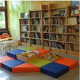
RPT, Ref. 23.5

Gemeindebücherei Grund- und Hauptschule Baidt