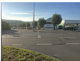
Regierungspräsidium Tübingen Knotenpunkt Halskestraße - Am Heilbrunnen Blickrichtung Achalm