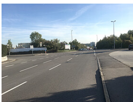
Regierungspräsidium Tübingen Knotenpunkt Halskestraße - Am Heilbrunnen