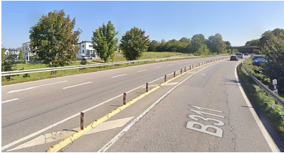
B 311 im Verlauf der Ortsumfahrung Ehingen