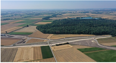
Luftbild von der Baustelle an der B 311, Querspange zur B 30 bei Erbach (Stand: Sommer 2022)