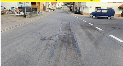
Ortsdurchfahrt von Burladingen-Stetten