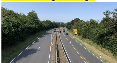
B 28 zwischen Tübingen und Reutlingen