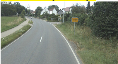
L 1261 am Ortseingang von Steinberg