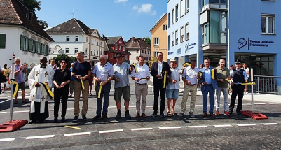
Banddurchschnitt bei der Verkehrsfreigabe der Eschachbrücke in Leutkirch