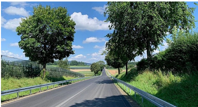
Sanierte B 33 in Blickrichtung von Ittendorf in Richtung Wirrensegel