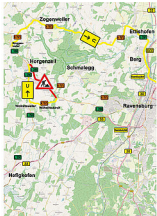
Umleitungsskizze L 288 Horgenzell - Ravensburg; 1. Bauabschnitt