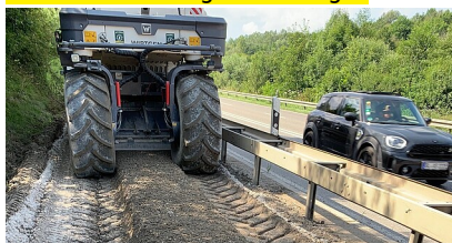
B 463, Radwegsanierung bei Balingen-Endingen und Balingen-Frommern