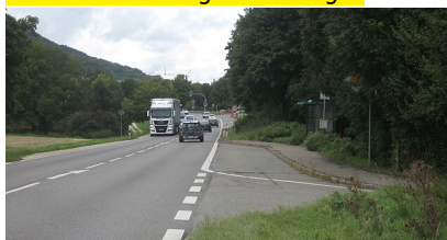
B 28 Dettingen/Erms Anschluss Bleiche