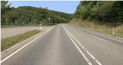
Zwiefalter Steige im Verlauf der B 312