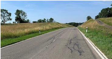
L 196 zwischen Meßstetten-Hartheim und Meßstetten