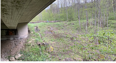
Eyachbrücke westlich von Albstadt-Laufen