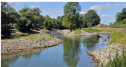
Jonas Hube | Ref. 52 | RPT

Flusspark Neckaraue Tübingen - Nach Ostern Baustart für den Hochwasserschutz